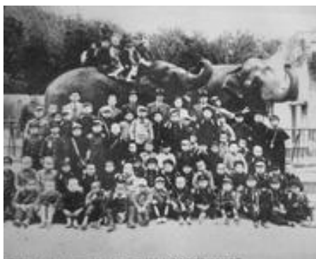
当時の東山動物園で象に乗って遊んだ子どもたちの様子

長い戦争が終わり、各地で子ども議会が作られました。そこで子どもたちが話し合ったこと。