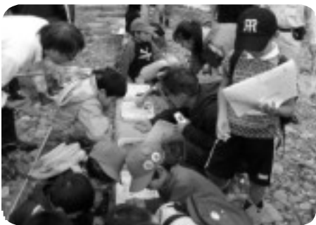
どんな水生昆虫が住んでる？河川観察会の様子

答 町民主導による計画です。アクションがあれば可能な限り関係機関と調整し支援していきたいと考えます。